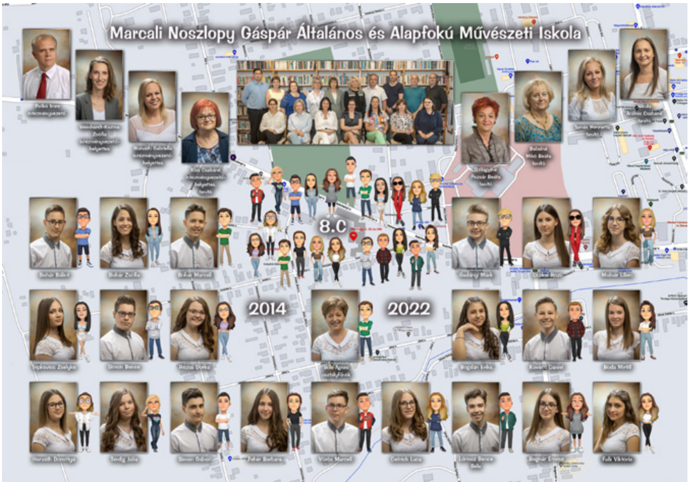
A tablót Horváth Krisztián készítette