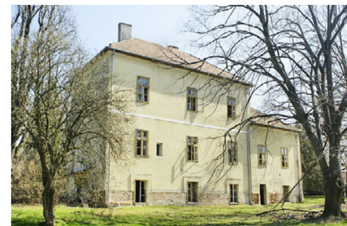
A boronkai kastély udvari képe 2013-ban