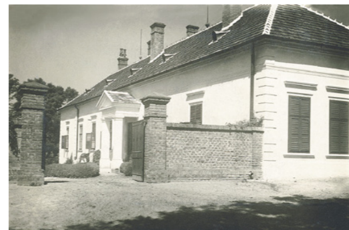
A boronkai Széchenyi kastély utcai képe 1936-ban