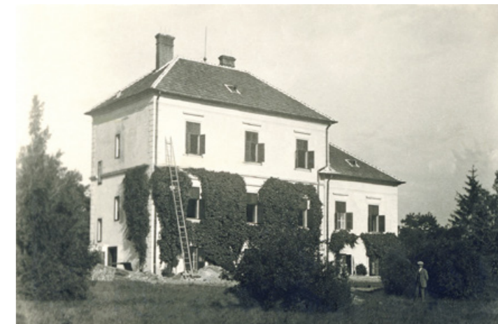
A boronkai Széchenyi kastély udvari képe 1936-ban (Csomós László felvétele, a Marcali Múzeum gyűjteményéből. A fotót retusálta Ilácsa József.)

A grófi család 1943-ig lakta a kastélyt, majd átköltöztek Marcaliba, miután Széchenyi Andor Pál meghalt. A világháborút követően, a háborús sérülésekkel tarkított és kifosztott épületben – a lebombázott iskola helyett – a katolikus elemi oktatás zajlott 1950-ig, az államosításig, utána állami 8 osztályos általános iskolaként szolgált tíz éven át.