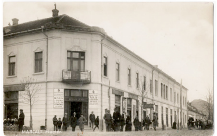
A Kopári-üzletház és Korona szálloda 1940 körül (Képeslap, a Marcali Múzeum gyűjteményéből)

üzlet vezetését. Megszervezte a Marcali Kereskedők Egyesületét, vezető szerepet vitt a Marcali Villamossági Rt. megalapításában is. A Magyar Vaskereskedők Országos Egyesülete igazgatósági tagjává választotta. Választmányi tagja volt az épület emeletén működő Marcali Járási Kaszinónak és elnöke a Katolikus Legényegylet Sportosztályának. A második világháborúban tartalékos hadnagyként szolgált, amikor a Szolnok ellen intézett bombatámadásnál hősi halált halt. Az általa működtetett, 8-10 alkalmazottat foglalkoztató vas-fűszer-csemege kereskedés az egyik legjobb hírű volt a Dunántúlon, hiszen az 1841-ben alapított Iszti-kereskedés jogutódja volt. Már a harmincas években benzinkút is működött az épület előtt. A népnyelv „Kopári-sarok”-nak nevezte el ezt az utcacsarkot, s az útkereszteződés mentén havi- és heti vásárokat is rendeztek.