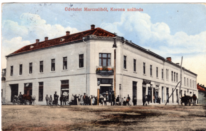
Az épület 1922-ben