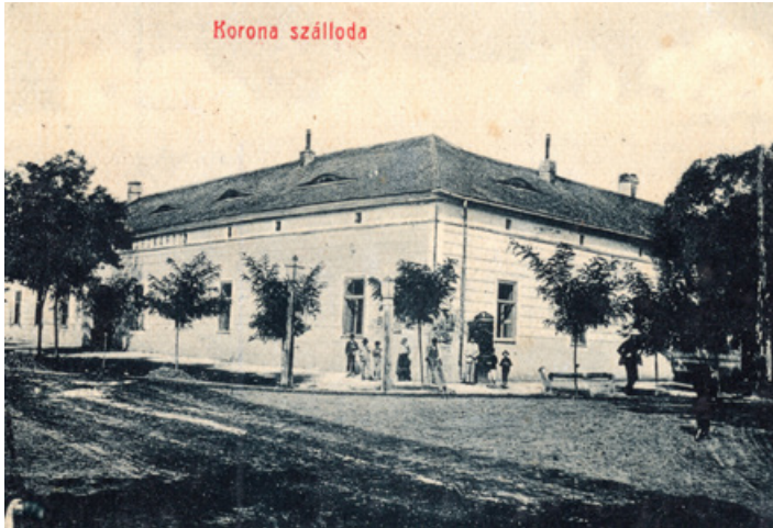
A Korona szálloda épülete 1910 körül