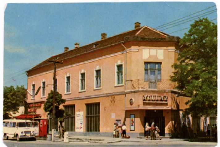
Az ÁFÉSZ Áruháza és a benzinkút 1969-ben (Képeslap, a Marcali Múzeum gyűjteményéből)

A Kopári-üzletháznak leginkább a Komáromi Lajos vezette „Hangya” Országos Fogyasztási és Értékesítési Szövetkezet boltja volt a legfőbb konkurenciája. A második világháború után a család próbálta életben tartani az üzletet, de az 1949-es államosítást és végrehajtást követően a Földműves Szövetkezet kapta meg és üzemeltette tovább.