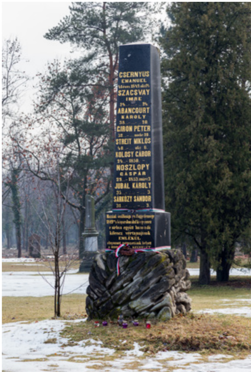
Noszlopy Gáspár és nyolc mártírtársának közös síremléke a Kerepesi úti temetőben