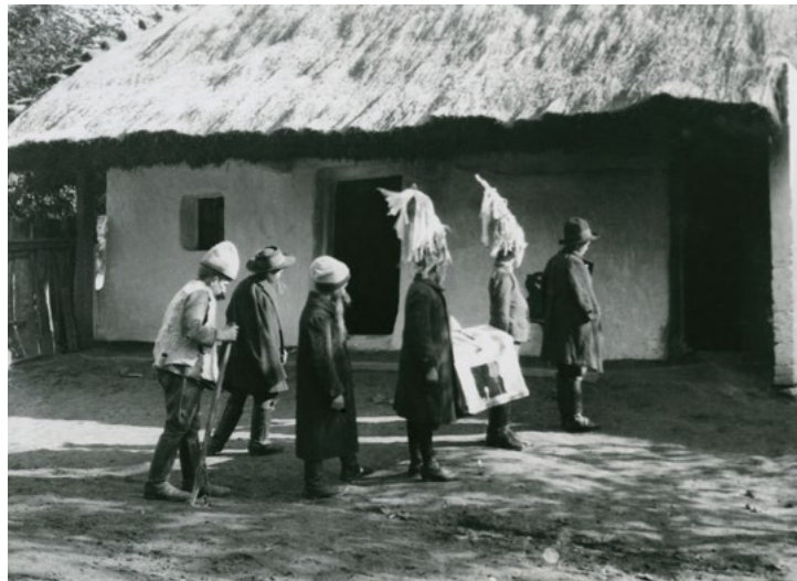
Pásztorjáték Marcaliban 1950 körül Beck Lajosné gyűjteményéből

A Marcali járás sok helységéből van adatunk a bábtáncoltató betlehemes hagyományokról, így például Balatonberény, Balatonkeresztúr, Balatonszentgyörgy, Csákány, Hollád, Kéthely, Marcali, Mesztegyő, Somogyfajsz, Szegerdő, Táská, Tikos, Vörs településekről. Napjainkban is él a szokás Balatonberényben, Holládon, Mesztegyőn, Vörsön, s felújítását tervezik például Kéthelyen.