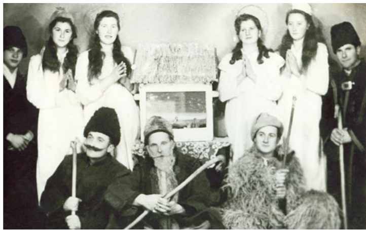
Marcali betlehemesek 1926-ban

A történeti-néprajzi kutatások fényt derítettek arra, hogy a karácsonyi bábos betlehemezés a 18. századtól terjedt el Magyarország egyes területein. A dunántúli betlehemes játékokban feltűnő bábok a 19. században jelentek meg az adott táj jellegzetes, falusi betlehemes játékaikhoz kapcsolódóan. A bábfigurák a városok piacterein és kocsmáiban felbukkanó vándor bábosoktól jutottak el a falusi közösségek betlehemes csoportjaihoz.