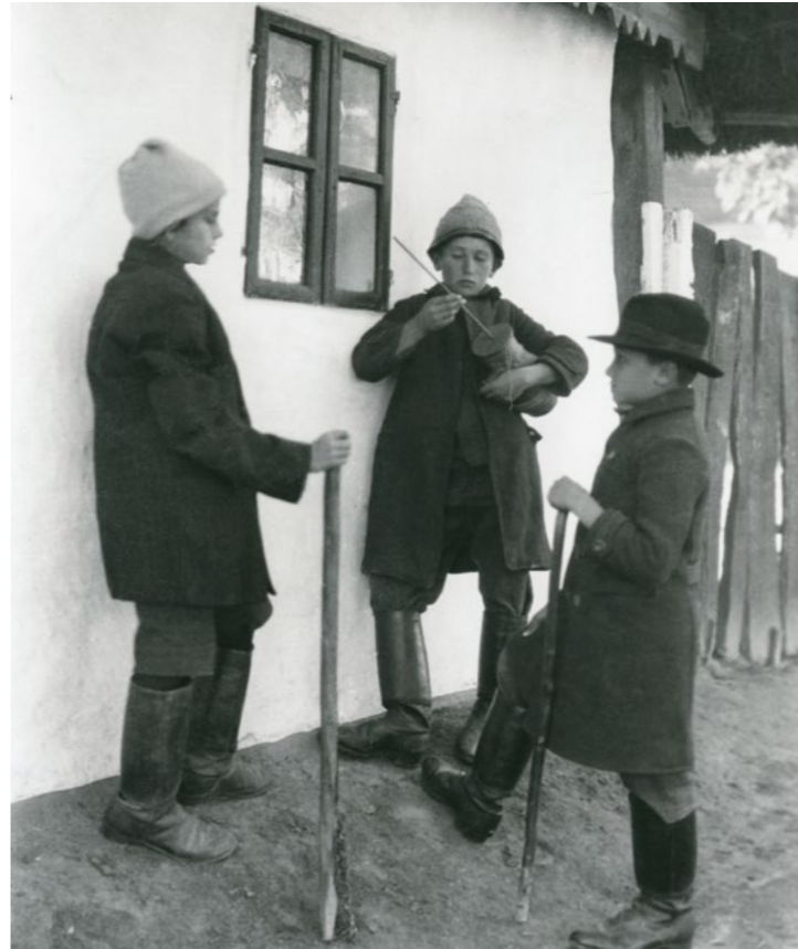
Marcali regölők láncos bottal és „szotyogatóval” 1926-ban

A magyarság egyik legarchaikusabb népszokása, a regölés általában István napján vette kezdetét. A kutatás a finnugor sámánritusok maradványait fedezte fel benne. A regösök, eredeti felfogás szerint, varázslók. A szó mágikus erejébe vetett hit alapján kívánnak szerencsés évkezdést, termékenységet, boldogságot. A középkorban – feltehetően – országosan ismert volt. A 20. századi kutatók elsősorban a Dunántúlon, valamint Székelyföldön és Moldvában találtak regösénekeket.