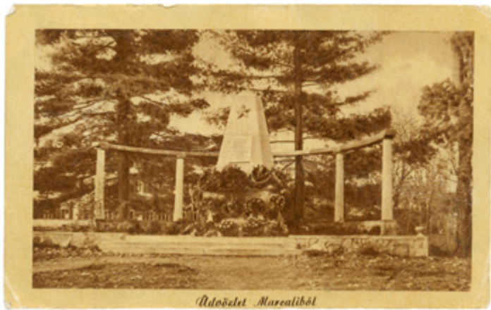
A szovjet hősi temető obeliszkje a kórházparkban

Az 1956-os forradalom és szabadságharc kivétel nélkül érintette Magyarország összes településének az életét, így Marcaliét is. Az egykori község abból a szempontból volt egyedi, hogy két katonai laktanya is működött a területén, így az október 23-át követő napok helyi eseményeinek az alakítói a lakosság mellett a katonaságot is mélyen érintették. A forradalom kitöréséről már a rádióból értesültek a helybeliek, másnap pedig a város laktanyáiban riadót rendeltek el, majd tájékoztatták a katonákat a politikai apparátus tagjai. Délelőtt már az egész település tudott a Budapesten történekről.