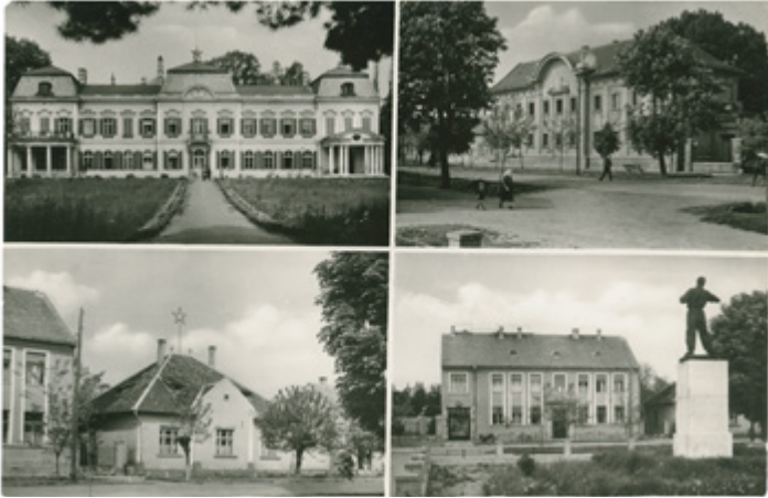
A járási kórház, a rendőrség, a bíróság és a pártbizottság épületei és a Vádló szobor az 1950-es években készült képeslapon

Az 1956-os forradalom és szabadságharc kivétel nélkül érintette Magyarország összes településének az életét, így Marcaliét is. Az egykori község abból a szempontból volt egyedi, hogy két katonai laktanya is működött a területén, így az október 23-át követő napok helyi eseményeinek az alakítói a lakosság mellett a katonaságot is mélyen érintették. A forradalom kitöréséről már a rádióból értesültek a helybeliek, másnap pedig a város laktanyáiban riadót rendeltek el, majd tájékoztatták a katonákat a politikai apparátus tagjai. Délelőtt már az egész település tudott a Budapesten történekről.