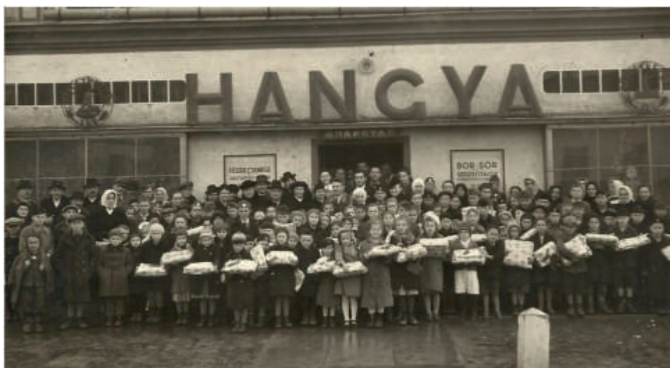
Ez a kép 1942 decemberében készült. A Marcali Hangya Szövetkezet karácsonyi ajándékot adott a fronthon harcolók gyerekeinek illetve a hadiárvának. (Lángi Béla)