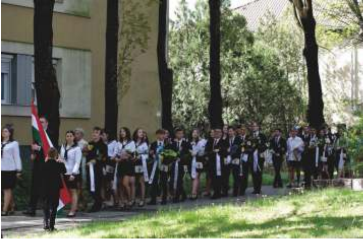
Marcali Berzsényi Dániel Gimnázium

Ebben a tanévben április végén újra hagyományos módon ballaghattak el középiskolásaink. A legnagyobb elismerésben részesült tanulók: