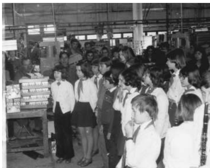
Anyák napi ünnepség a Mechanikai Művekben az 1970-es években.

Az idén úgy látszik, torlódtak az ünnepek, egyetlen hétvégére három is jutott belőlük: anyák napja május elsejére esett, a középiskolai ballagások pedig előtte nap voltak.