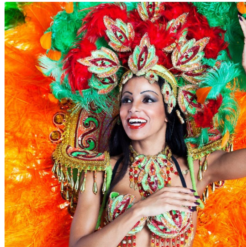
Rio de Janeiro

A farsangolás szokását a portugál telepesek hozták magukkal az óhazából, és újdonsült otthonukban is meghonosították. Rióban, az egykori koronázó - és fővárosban az elmúlt száz esztendőben minden évben megtartották a karnevált, elhalasztani is csak egyszer halasztották el, a belügyminiszterük halála miatt. A mulatozás idegenforgalmi attrakció is egyben, több milliós vendégereggel, csillagászati bevételekkel. A kikötőben ilyenkor óriási szállodahajók horgonyoznak, némelyik akkora, hogy egész Marcali elférne rajta.