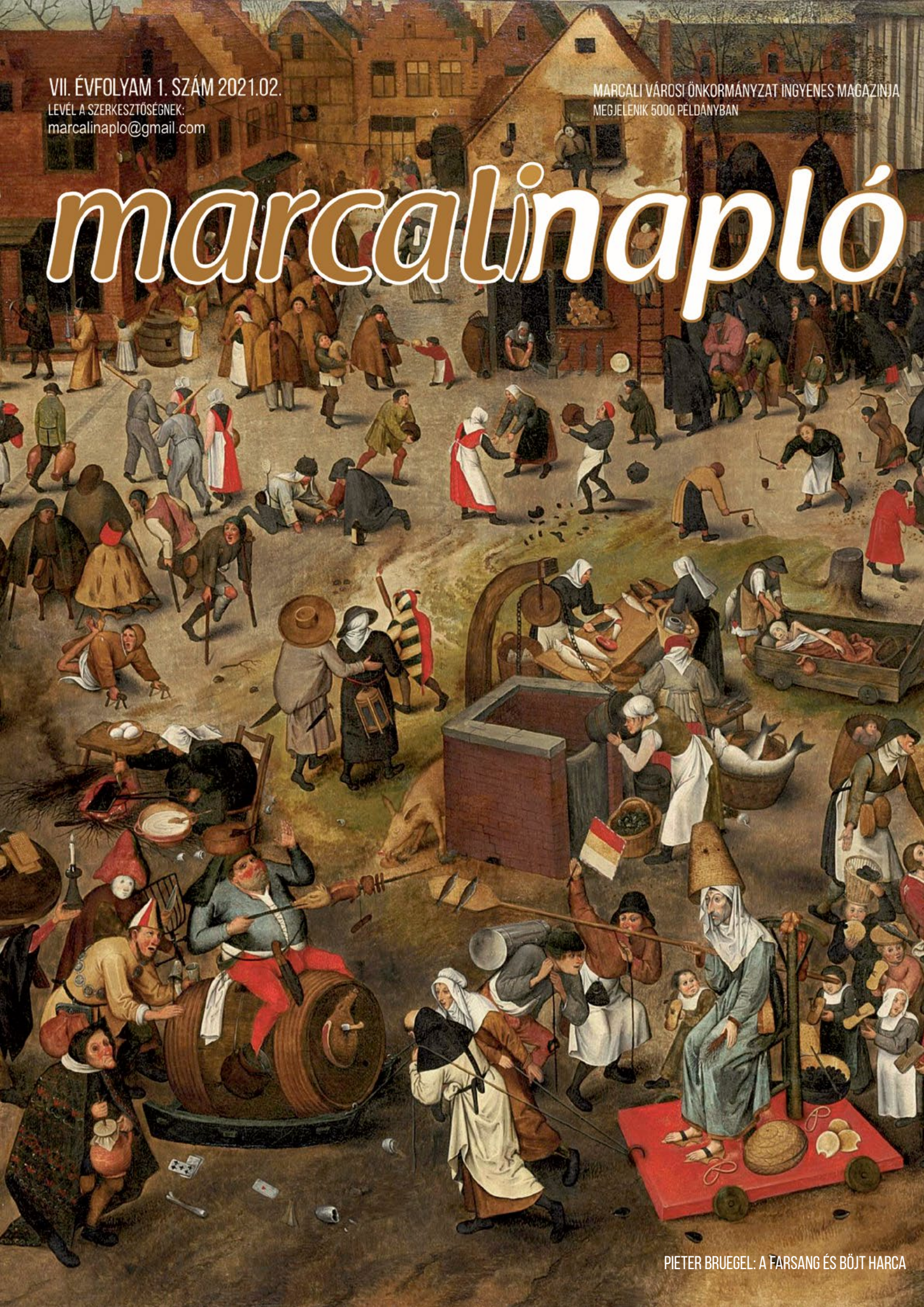
PIETER BRUEGEL: A FARSANG ÉS BÖJT HARCA