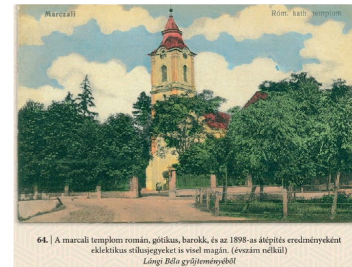
64. | A marcali templom román, gótikus, barokk, és az 1898-as átépítés eredményeként eklektikus stílusjegyeket is visel magán. (évszám nélkül)

közparkok részletei, a szabadidős tevékenységek helyszínei tematikus közelítésben tűnnek fel. Az „Elő- és hátlapok titkai” című fejezet bepillantást enged a képeslapok feladóinak személyes világába.