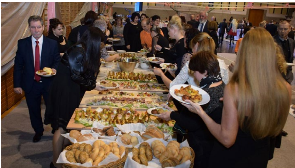
Marcali Polgári Bál

A hatalmas buli indulására a polgármester ad jelet azzal, hogy a város kulcsát átnyújtja Momo királynak, aki majd az egészet vezényli. Felsorolni is lehetetlen a számtalan eseményt, ami emeli a hangulatot, de el lehet képzelni, mi minden történhet ott, ahol hatszáz utcát zárnak le. A legnagyobb attrakció a szambaiskolák felvonulása és versenye, amire egész évben készülnek a résztvevők, már az is rangot jelent, ha valaki egyáltalán bemutatkozhat itt. Mindez a karneváli főutcán zajlik, ami valójában egy stadionszerű építmény: külön erre az alkalomra készült, hossza mintegy másfél kilométer, Szabadrom a neve. Százegrekben mérhető nézősereg és negyven tagú zsűri előtt megszólaló több ezer dob hangjára indulnak meg a koscsik, rajtuk az iskolák saját zenekarokkal kísért táncosai: forró hangulatú produkciók, káprázatos ruhák, szebbnél szebb nők gyönyörűsége /ám a megfelelő helyeken fölöttébb anyagtakarékos/ jelmezekben.