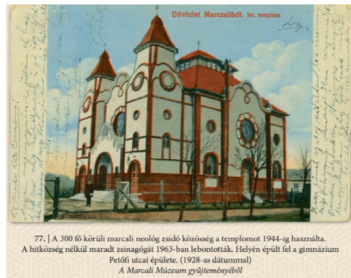
77. | A 300 fő körüli marcali neológ zsidó közösség a templomot 1944-ig használta. A hitközség nélkül maradt zsinagógát 1963-ban lebontották. Helyén épült fel a gimnázium Petőfi utcai épülete. (1928-as dátummal) A Marcali Múzeum gyűjteményéből

Az „Üdvözlés Marcaliból! Egy somogyi város múltja és jelene képeslapokon” című könyv a Marcali Múzeum által 2016-ban elindított Életmód és településtörténet képekben címet viselő kiadványsorozat második köteteként jelent meg. A szép kivitelű könyv a magyar mellett négy idegen nyelven – németül, angolul, románul és lengyelül – teszi megismerhetővé a képaláírásokon keresztül a várostörténet egyes szeleteit. Így Marcali testvértelepüléseinek, illetve „partnertárságának” lakói anyanyelvükön szerezhetnek mélyebb ismereteket városunkról.