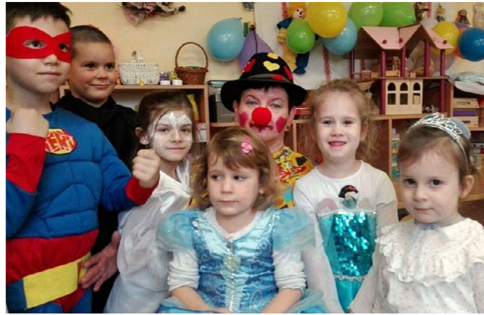
Marcali Gombácska Óvodai Farsang

Somogyország híres megyebálgájainak „égi mását” nem kisebb költő örökítette meg, mint Csokonai Vitéz Mihály. Dorottya, vagyis a dáma diadalma a farságon című vígopozsának alapkomikuma arra épül, hogy a teljes eposzi kelléktárat egy igencsak kisszerű témához vonultatja fel: Az eposzokban megéneklendő,