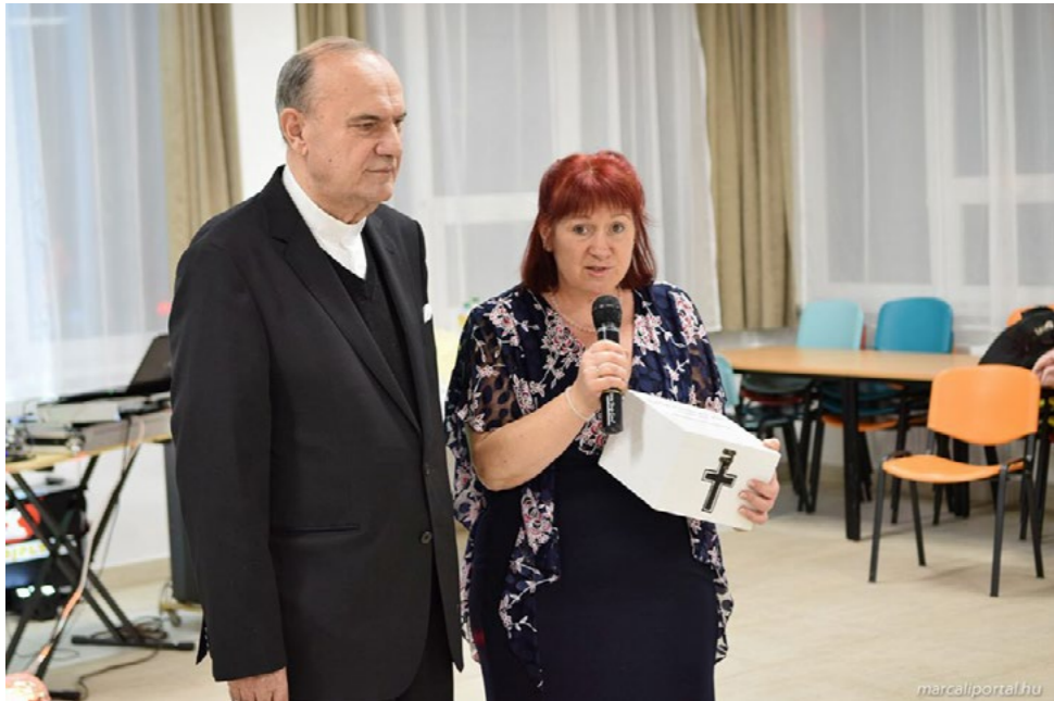
Marcali Katolikus Bál