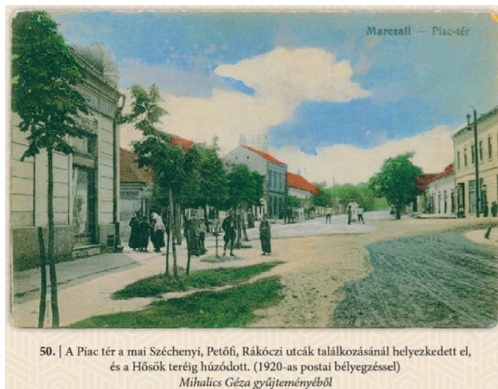
50. | A Piac tér a mai Széchenyi, Petőfi, Rákóczi utcák találkozásánál helyezkedett el, és a Hősök téréig húzódtott. (1920-as postai bélyegzéssel)