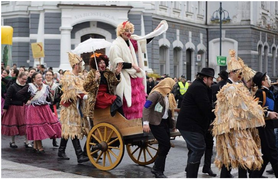
Kaposvári Dorottya Farsangi Napok