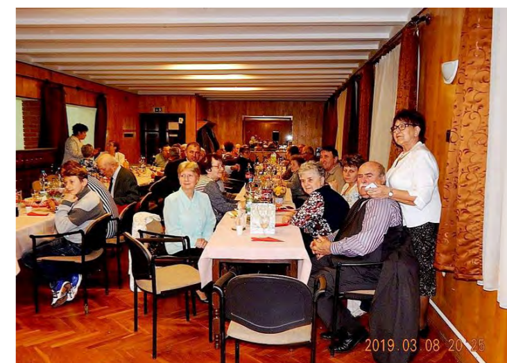
Marcali Bajtársi Egyesület