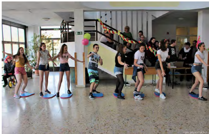
Marcali Berzsenyi Dániel Gimnázium