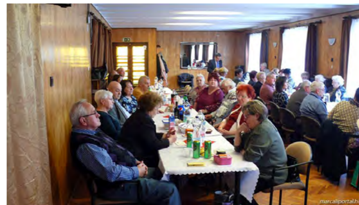
Honvéd Nyugdíjas Klub

A településrészi önkormányzatok, a város egyesületei, civil szervezetei is műsorral, összejövetellel, kis ajándékkal kedveskedtek a hölgyeknek nőnapon.