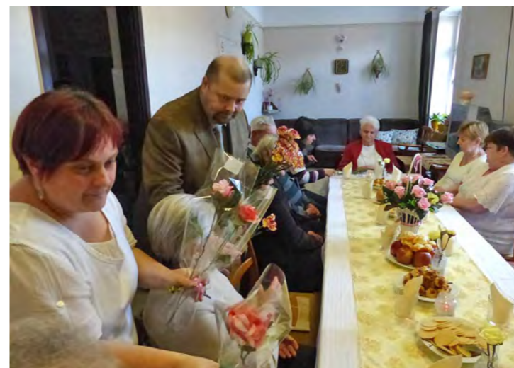
II. számú Idősek Klubja