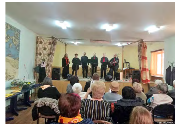
Tavaszcímű nőnapos rendezvény Gyótán