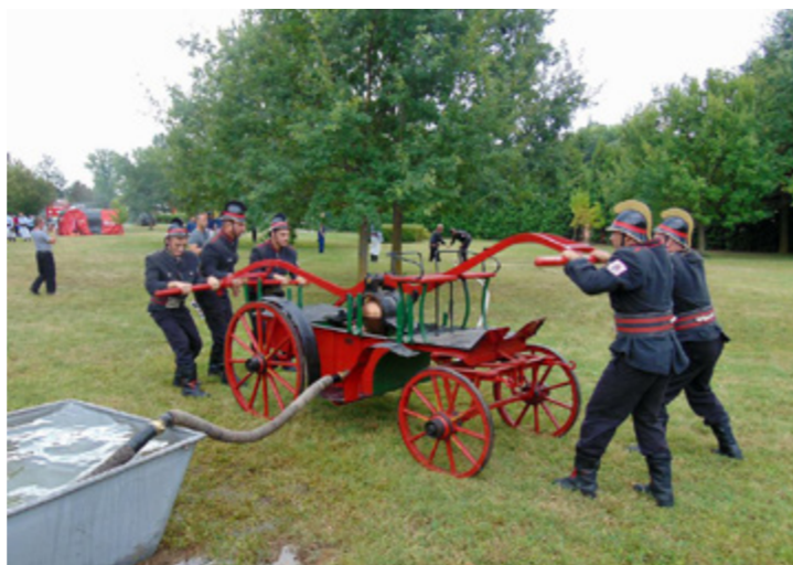
TŰZOLTÓ HAGYOMÁNYÓRZÓ KOCSIFECSKENDŐ VERSENY