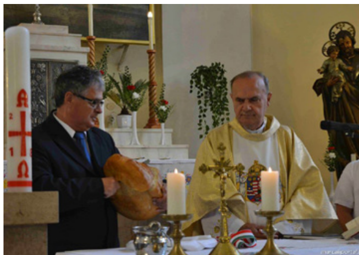
ÜNNEPI SZENTMISE AUGUSZTUS 20-ÁN