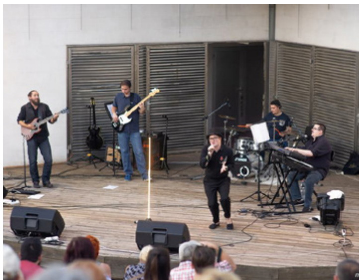
KONCERT A SZABADTÉRI SZÍNPADON