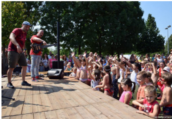
LURKÓ NAP A FÜRDŐBEN