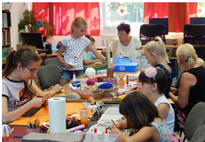
JÁTSZÓHÁZ A KÖNYVTÁRBAN

Művészeti együtteseink pedig a város határain túl is vállaltak fellépéseket, különböző településeken öregbítve Marcali hírnevét.