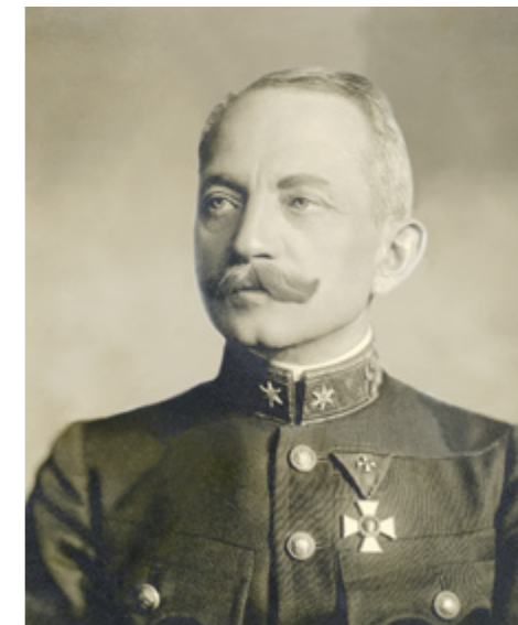
Kozma Ferenc portréja (Magyar Nemzeti Múzeum gyűjteménye)