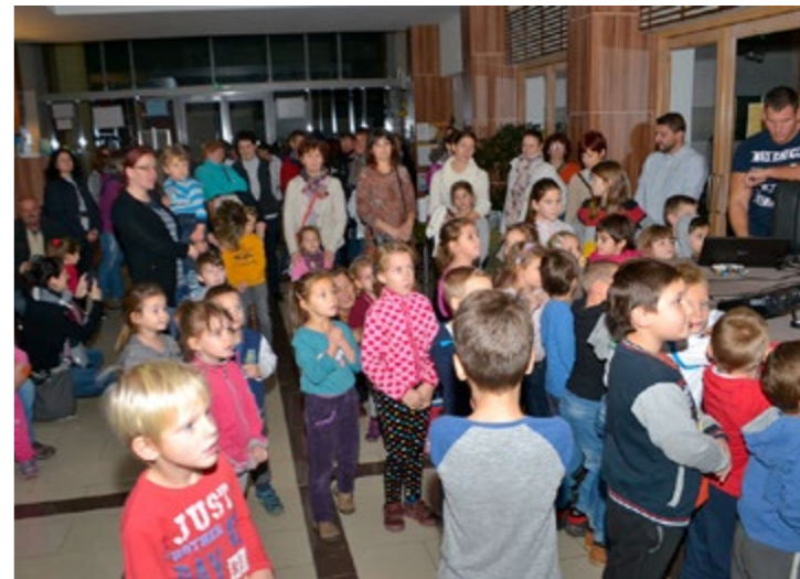
A Meseperk Óvoda Márton-napi lámpás felvonulói a Korzóban