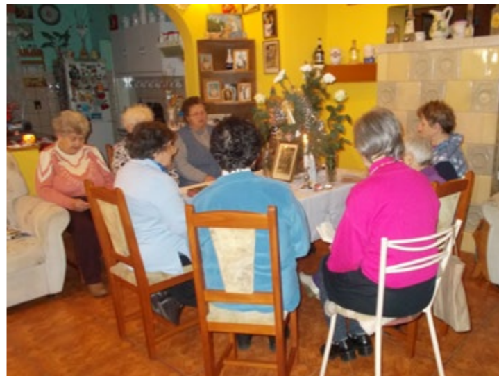
Szentcsaládjárás Marcaliban, 2016-ban.

Luca napját az egész magyar nyelvterületen gonoszjáró napnak tartották, ezért különösen a boszorkányok rontása ellen kellett védekezni, például fokhagymával. E naphoz országszerte, így Marcali környékén is munkatiltalmak kapcsolódtak. A környékbeli asszonyok úgy tartották, ha ekkor fonnának, varmának, akkor befoltoznak a tyúkok hátsófelét, és azok nem tudnának tojni. Erre a napra javasolt munka volt mindenfajta fejtő-bontó tevékenység, például tollat fosztottak, babot fejtek, hogy a tyúkok könnyen tojjanak. Termékenységvarázsló rítusok is fűződtek hozzá. Környékünkön fiúgyermekek jártak kotyulni: házról-házra mentek és bőséget, termékenységet serkentő énekeket, verseket mondtak. Egy-egy házhoz betérve engedélyt kértek: „Szabad-e kotyulni?” Ha megengedték, akkor ráültek egy tuskóra vagy egy köteg szalmára, és elkezdtek mondókájukat. Az alábbiakban marcali kotyuló vers részletét idézzük az 1930-as évekből: „Jó reggelt a Lucának, Luca fekszik ágyába, Gyere Luca, menjünk el, Mennyorszót nyerjünk el, Aki aztat elnyeri, Boldog lesz azéleti. Kitty-kotty kur, Gelegonya kettő nekem is van kettő.” Bizén így folytatták: „A háziasszonynak anynyi libája, kacsája, csibéje legyen, Mint az égen a csillag, a földön a fűszál. Kitty-kotty, gelegonya kettő, nekem is van kettő.”