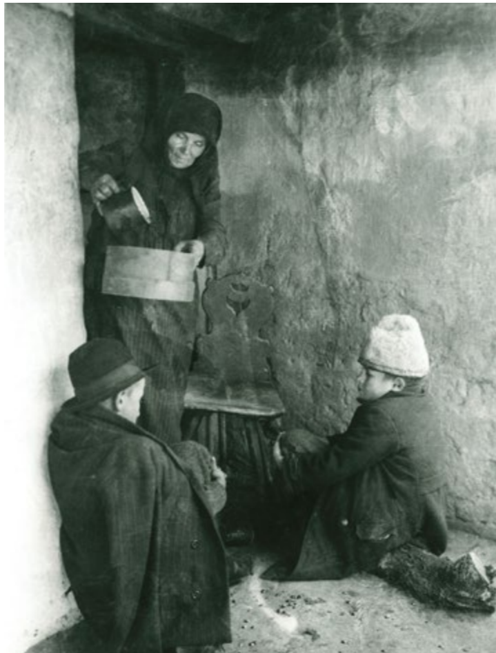
Luca-napi kotyulók Marcaliban, 1926-ban

orosz 'gyed moroz' fordításaként. Napjainkban e kettős megnevezéssel találkozunk, a Mikulás-Téalap alakja versekben, énekekben, szerepjátékokban és a kereskedelemben egyaránt jelen van.