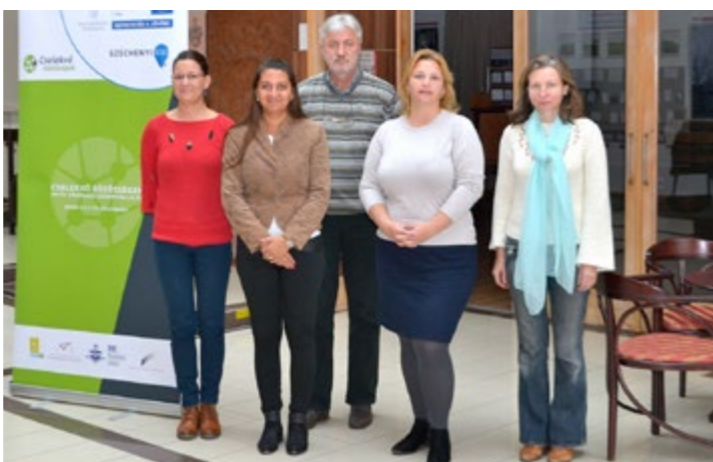
Somogy megye közösségfejlesztő mentorai