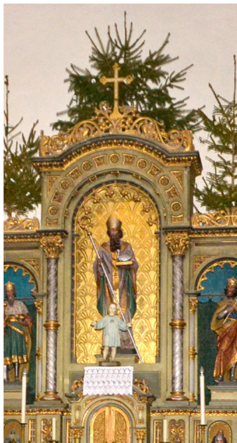
Szent Márton püspök szobra a vörsi templom főoltárán.

Fonyód, Polány, Táska és Vörs templomának a patrónusa. Szent Márton napjához számos hagyomány fűződik. A pásztorok vesszőt adtak ajándékba a gazdáknak, s úgy tartották, ahány ága van Szent Márton vesszejének, annyi malaca lesz a kocának. Általánosan ismert az a mondat is, hogy „Aki Márton napon libát nem eszik, egész éven át éhezik.” A szólás eredete a szent legendájával függ össze: Szent Márton a ludak