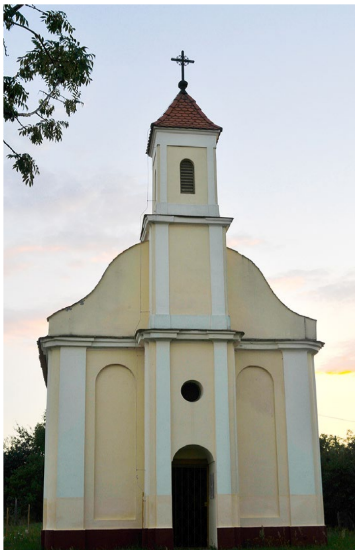
A marcali Szent Orbán kápolna

Szent Flórián a tűzoltók és a tűzzel dolgozók védőszentje. Tisztelete az újkorban élenkült meg, s főként Közép-Európában volt jellemző. Patrónusoknak tekintették a kovácsok, pékek, fazekasok, sörfőzők, kéményseprők is. Somogyban több településen (például Somogyacsán, Somogyaracson) templomot szenteltek tiszteletére, de kápolnák, köztéri szobrok is mutatják kultuszát.