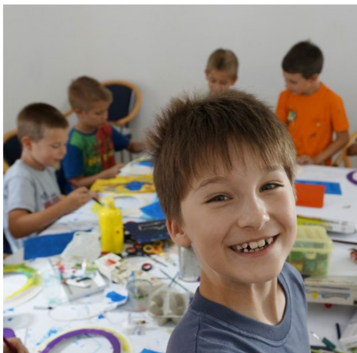
A műsorváltoztatás jogát fenntartjuk!

Gyermeknap programok a Kulturális Korzónál. Belépés: ingyenes!