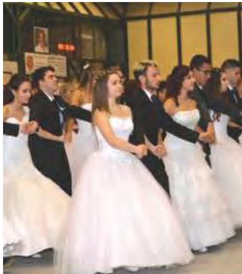
Marcali Berzsényi Dániel Gimnázium

dogul!". A szalag az iskolához tartozás, az identitás jelképe, melyet a végzős diákok szíve fölé, az elválás szimbolizálásaként tűztek fel. Jelentős esemény ez a tanulók életében, hisz lezárul egy korszak, de ez az ünnep még a felhőtlen együttlété.