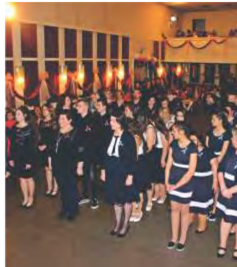
Siófoki SZC Marcali Szakgimnázium és Szakközépiskola