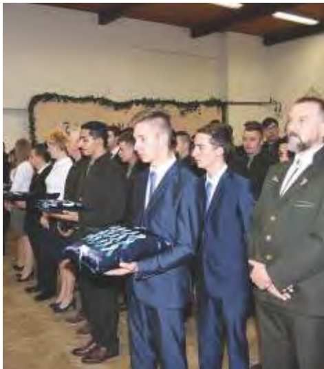
Széchenyi Zs. Mezőgazdasági Szakgimnázium, Szakközépiskola és Kollégium